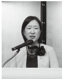
▲大久保朋果江東区長