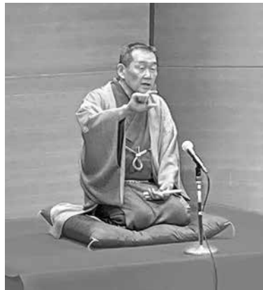
▲春風亭正朝師匠の高座

定刻18時開演。司会は真山副会長で、田口副会長が開会の辞を述べた後、南海トラフ地震や都市直下地震等に対する防火防災講習会として、