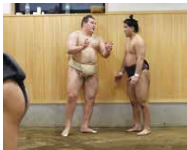
▲稽古中、後輩にアドバイスを安青錦