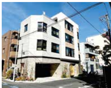
▲新築で立派な安治川部屋ビル

安治川部屋 あじがわべや 所在地：〒135-0014 江東区石島 4-1 電話：03-5683-0139 師匠：安治川 竜児 (元関脇 安美錦)