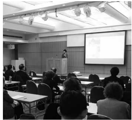
▲会場はティアラこうとうの大会議室