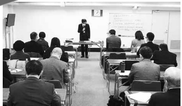
▲たくさんの方に参加していただきました

去る2月5日(水)、「退職金の源泉徴収と給与所得者の確定申告」と題した税務研修会を開催いたしました。今回は年度末に多い退職金や、近年サラリーマンの確定申告が増えている状況を勘案したテーマです。確定申告が増えている主な理由は、副業が認められて複数の企業からの給与所得がある方、ふるさと納税を利用する方などが増加しているためです。