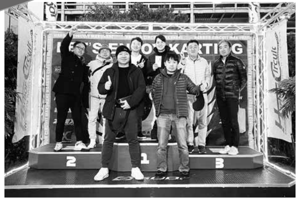
▲本格的なモータースポーツカートを楽しめるハーバーサーキット

1月18日(土)に健康経営企画として、ハーバーサーキット 幕張新都心店にて「青年部交流カート大会」を行いました。ゴーカート自体は小さいのですが、思った以上にスピードが出てとても迫力がありました。