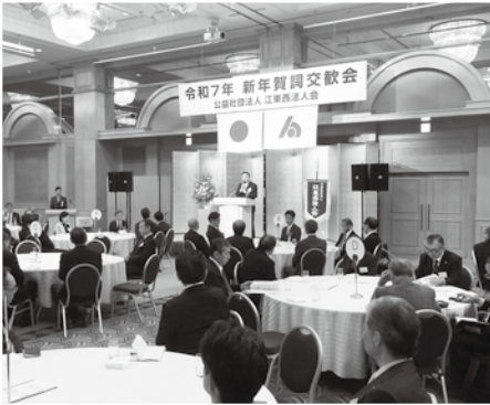
▼会場はホテルイースト21 東京の「永代」