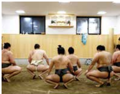
▲朝稽古の最後、神棚に向かい一同で蹲踞(そんきょ)して挨拶