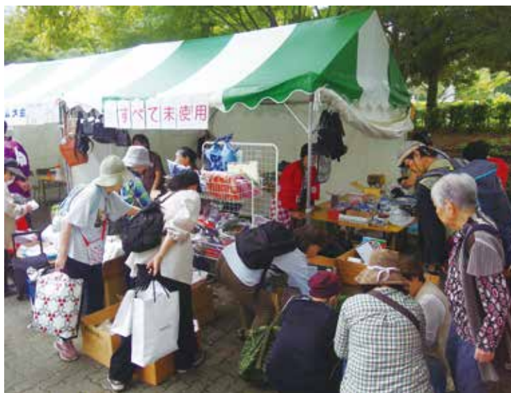
▲女性部会のチャリティーバザーは毎回大盛況