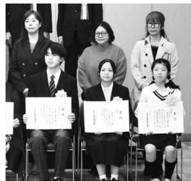
▲今年から区長賞が増え、11月5日（水）に江東区による表彰式が行われました。受賞作はp7に掲載しています

功労者への表彰後、女性部会による「小学生の『税に関する絵はがきコンクール』」の表彰式が行われました。これは税の知識と興味を広げるため、小学生を対象に絵と文言が付いた絵はがきを募集したもので、江東区内の小学校から293点もの力作が寄せられました。入賞者は左記の通りです。おめでとうございます！！