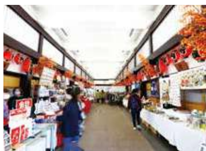
▲常設売店には昔ながらのお土産だけでなく、人気力士のグッズもたくさん揃っています ※博物館の営業日時とは異なります。