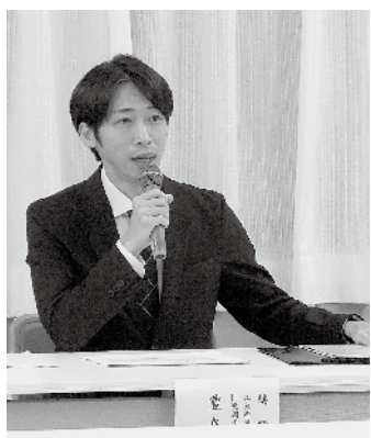
▲豊島国税調査官 （第3・10・11ブロック）

今回のテーマは「申告書の簡単なチェックポイントと税務調査」で、法人税や消費税で間違えやすい箇所の説明のほか、税務調査がどのような過程で進められるかなど具体的に解説して