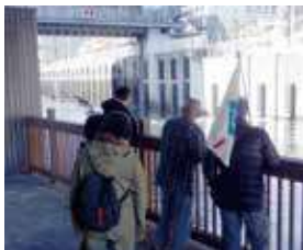
▲扇橋閘門が開きます！