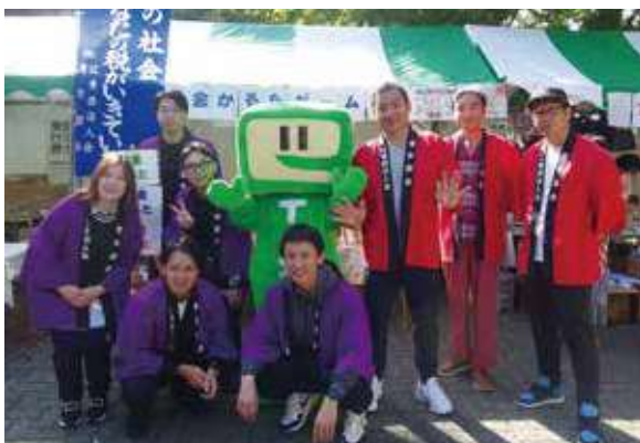
◀ 青年部会の皆さんお疲れ様でした