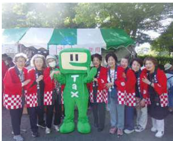
▲いつも元気な女性部会の皆さん。国税局 e-Tax のキャラクターのイータ君と記念撮影