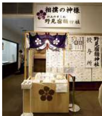
▲相撲の神様を祀る野見宿禰神社（のみのすくね）神社の授与所。社殿は墨田区亀沢2-8-10にあります