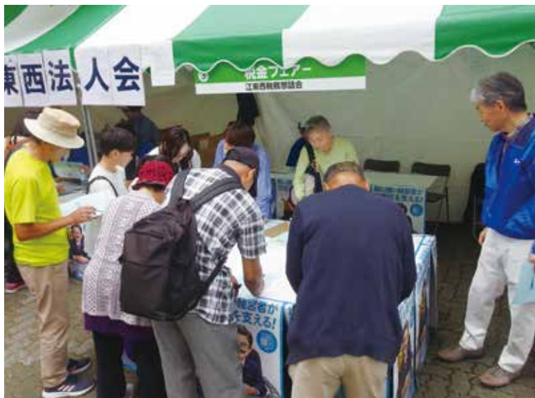
▲今回もたくさんの方にチャレンジしていただきました