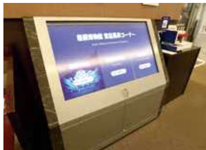
▲常設展示コーナー。相撲に関するさまざまな資料をタッチパネル操作で表示できます