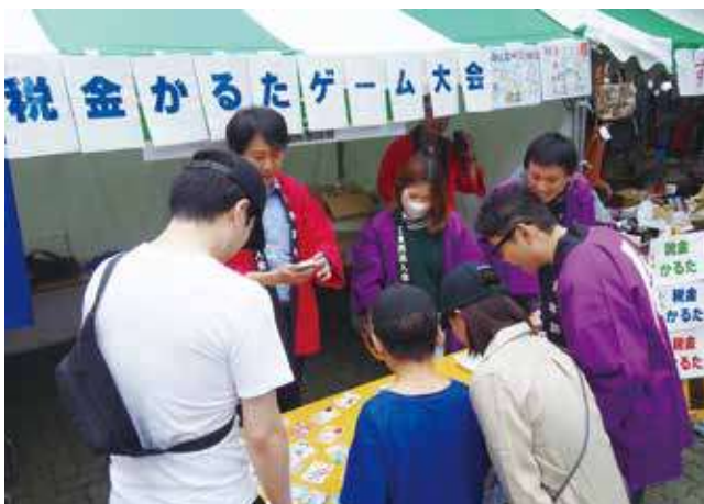
▲かるたとはいえ小学生も真剣です！