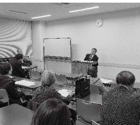
▲8・9ブロックの会場光景