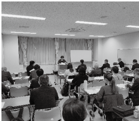
▲1・2・6・7ブロックの会場